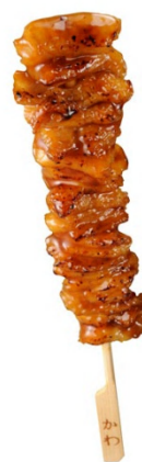
<炭火焼き鳥 かわ 105円>