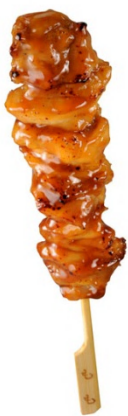
<炭火焼き鳥 もも 105円>