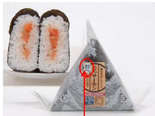
酢のりを使用していることを記載

回転寿司の人気ネタを参考に、サーモンや鮭に加えバリエーションをもたせたネタを具材に使用いたします。初回は、「とろサーモン」「ねぎとろ鮭」「いか明太子」の3種類を発売し、具材を変えながら、夏限定のシリーズとして発売いたします。