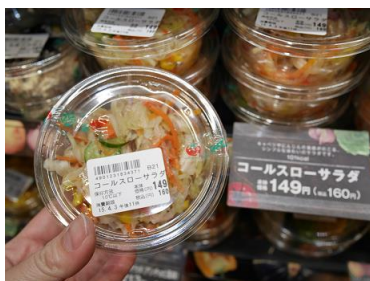
コールスローサラダ (税込:160円)

また、6月より発売を開始したレモン2個分の果肉量で作ったドリンク、「シスカレモン(税込:200円)」も好調な売上をみせております。