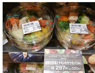
緑黄色野菜とチキンの サラダ(バジル) (税込:320円)