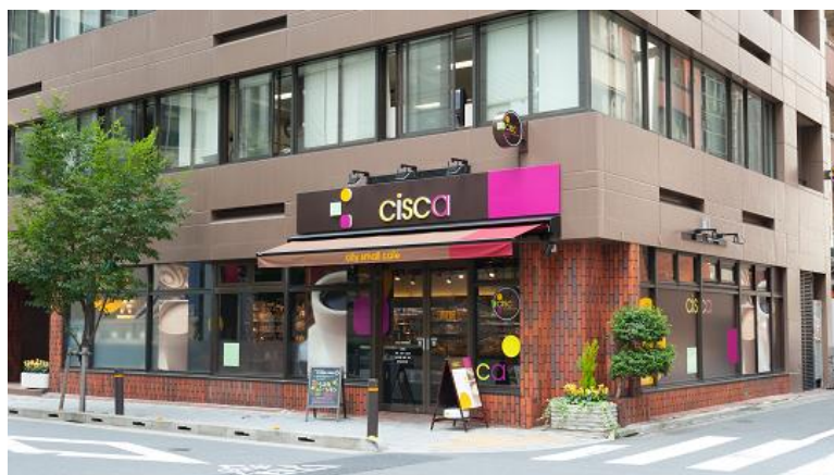
※cisca 日本橋本町店 店頭

その結果、カフェ+デリカテッセン(野菜を中心としたヘルシーな食事)+グロッサリー専門店を機軸とした業態の開発にいたしました。