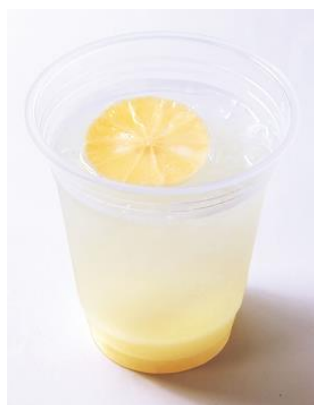
シスカレモン (税込:200円)