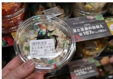
豆と豆腐の白和え (税込:180円)