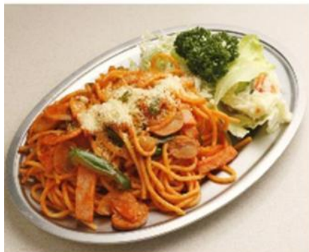
シンプルなおいしさで人気No.1 ナポリタン

昭和21年より神奈川県横浜市で愛されている「センターグリル」の味を、全国のミニストップからお届けします。