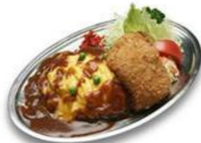
昭和21年創業時からの看板メニュー 「特製浜ランチ」