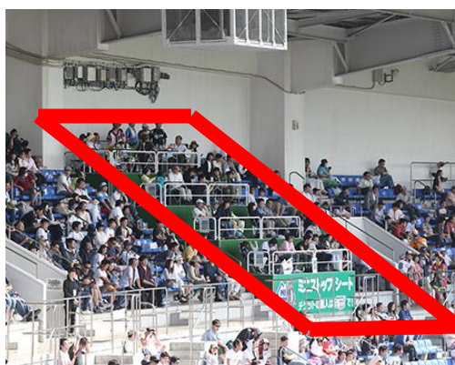
ミニストップシート