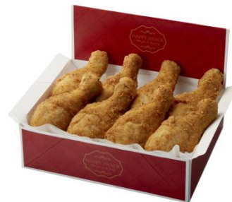
■極旨チキン(骨付き)8本セット 価格： 1,400円(税込) [4~8人向け]