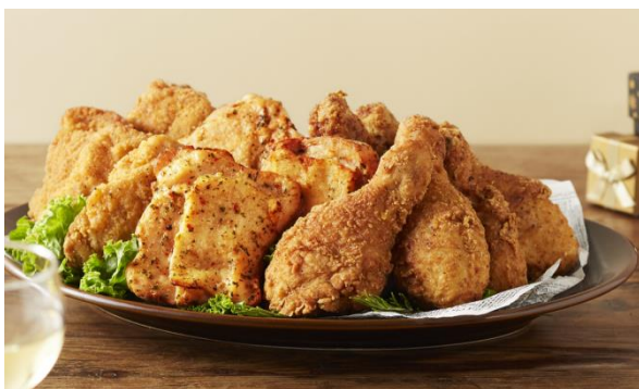
■よくばりチキンセット ・極旨チキン(骨付き)6本 ・ローストチキン(ハーブ&スパイス)4個 ・ジューシーチキン(プレーン)4個 価格： 2,100円(税込) [6~12人向け]