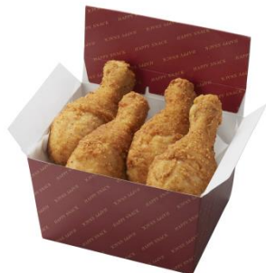
■極旨チキン(骨付き)4本セット 価格： 700円(税込) [2~4人向け]