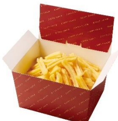
極旨チキン(骨付き)2個 薫るスモークチキン2個 エックスフライドポテト3個分