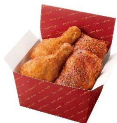
・極旨チキン(骨付き)2個 ・薫るスモークチキン2個