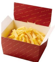
・極旨チキン(骨付き)2個 ・薫るスモークチキン2個 ・エックスフライドポテト3個分・クランキーチキンうま塩味4個分