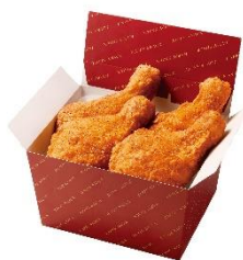
・極旨チキン(骨付き)4個

ミニストップではチキン・ポテトなどクリスマス向けの商品を2022年12月18日(日)まで予約実施しております。「極旨チキン」「薫るスモークチキン」「エックスフライドポテト」「クランキーチキンうま塩味」のお得なセットにてご用意しております。下記記載の商品は店頭にてご予約承っております。「ご予約申込書(お客さま控え・店舗控え)」に必要事項をご記入の上、ミニストップのレジカウンターに、ご予約申込書と代金を添えて、お申し込みください。