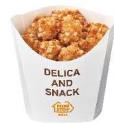
【クランキーチキン うま塩味カレー塩添付】