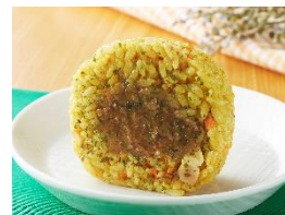
【日乃屋カレー監修 カレーピラフおにぎり】