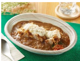
【日乃屋カレー監修 タルタルチキンカレー】