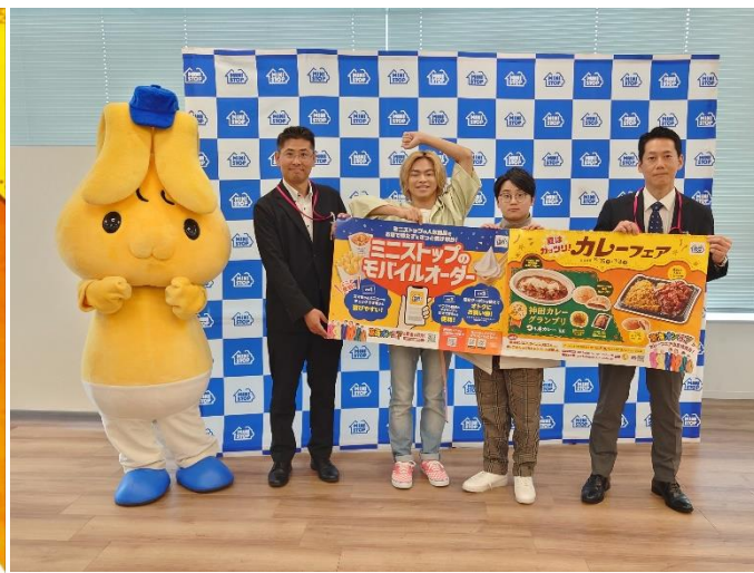
【カレーフェア説明会画像】