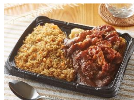
【盛旨っ！大好き カレー弁当】