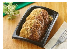
【日乃屋カレー監修カレー ソースのハンバーグカツ】