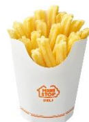
【Xフライドポテト カレー塩添付】