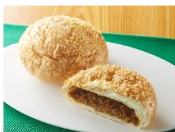
【日乃屋カレー監修 焼きカレーパン】