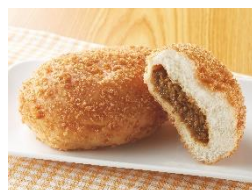
【コクとスパイスの かれーぱん】