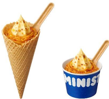
【プレミアム 紅はるかソフト】