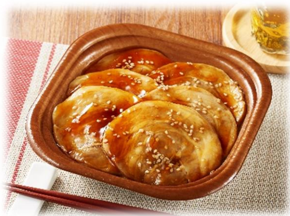
【期間中チャーシュー6枚入(2枚増量)】

※税込価格はお持ち帰り時に適用される軽減税率8%にて表示しております。イートインスペースで飲食される場合は、標準税率10%が適用されます。単品で購入した場合、税込価格の小数点以下は、切り捨てとなります。