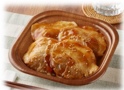
【通常チャーシュー4枚入】