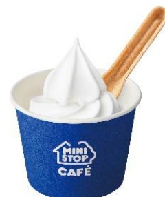
【カップ 北海道ミルクソフト】