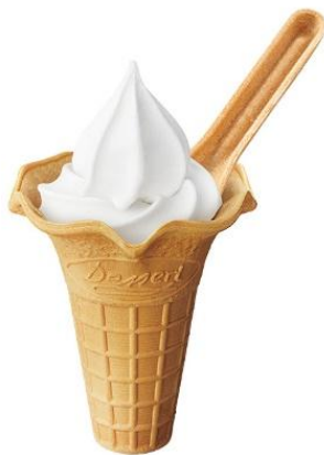
【北海道ミルクソフト】