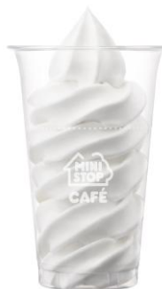
【得盛ソフトミルク】