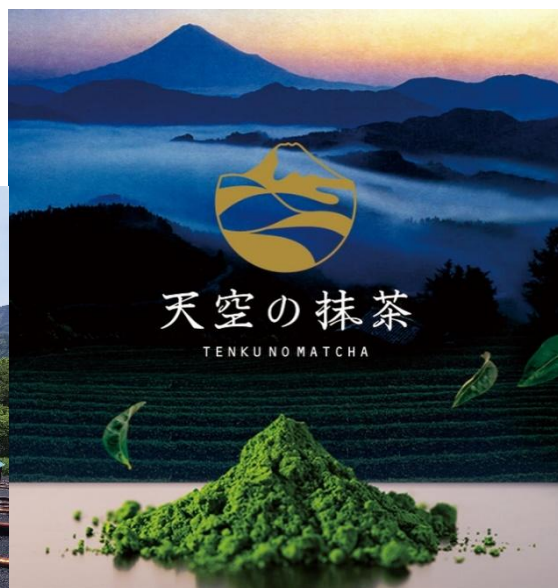
<天空の抹茶® (写真はイメージです。)>