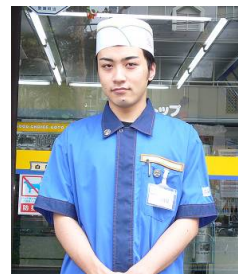
現行ユニフォーム