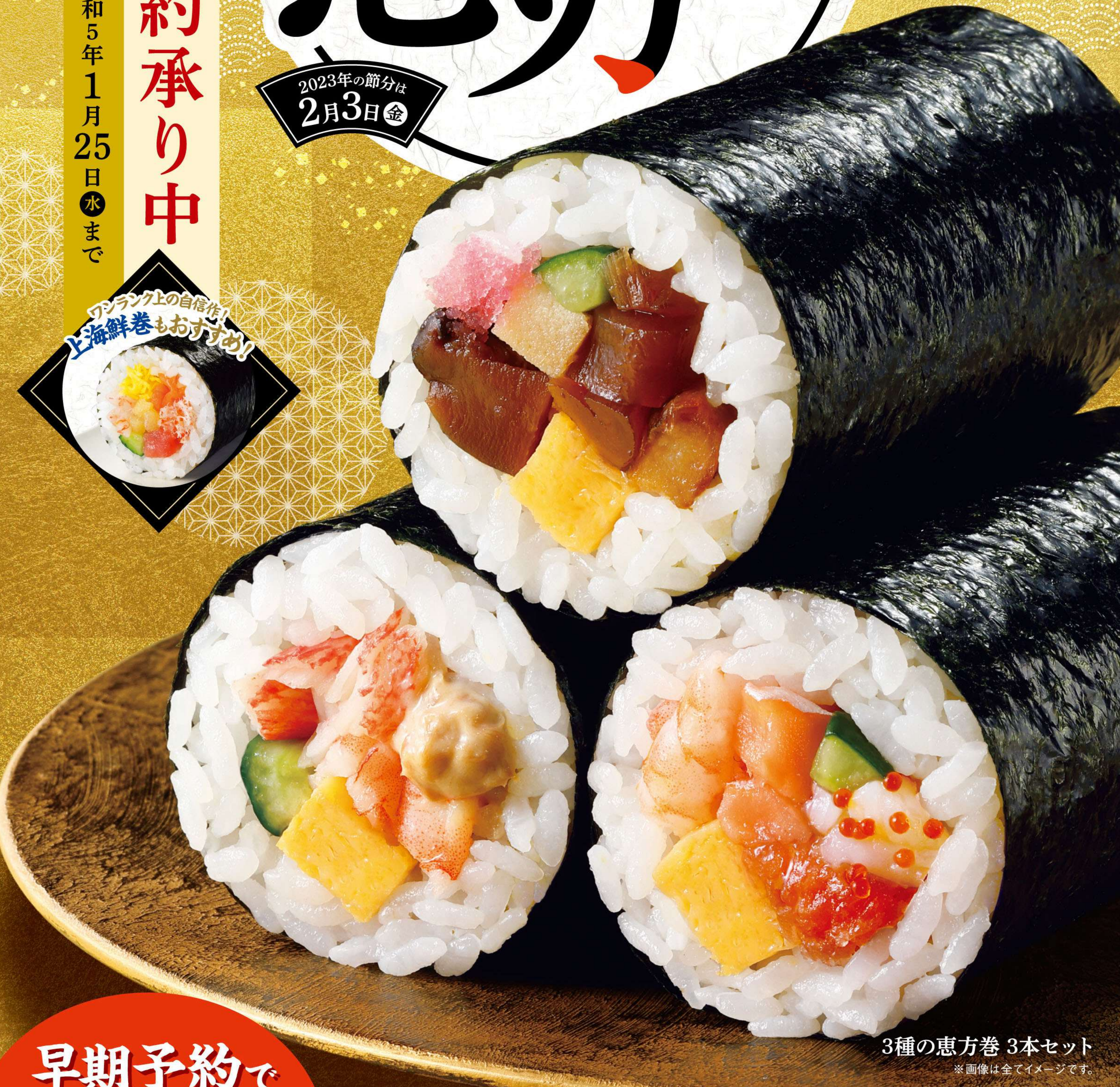
3種の恵方巻 3本セット ※画像は全てイメージです。